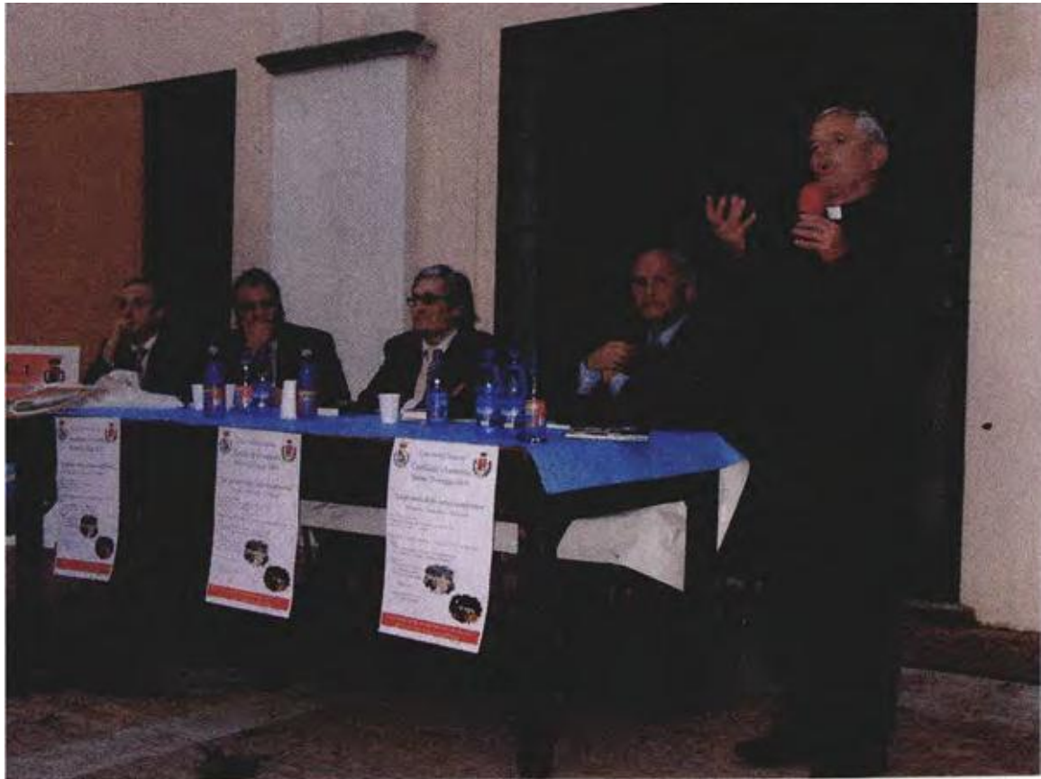
Conflenti Day – Lamezia Terme (CZ)