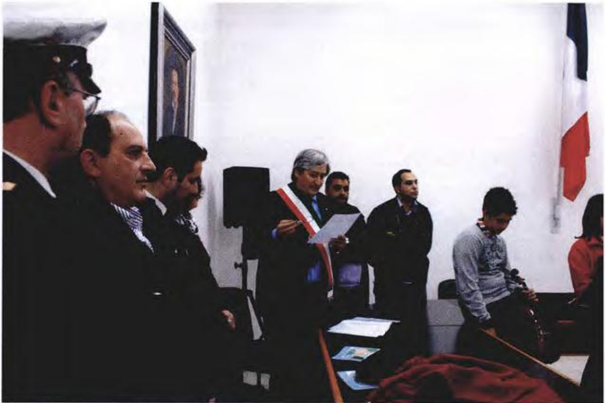
Festeggiamenti 150 anni Unità d'Italia