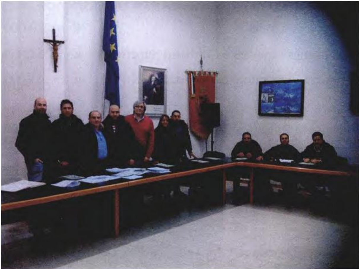
Consiglio Comunale che ha approvato il PSC.