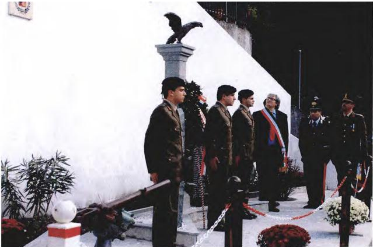
Inaugurazione monumento dei Caduti