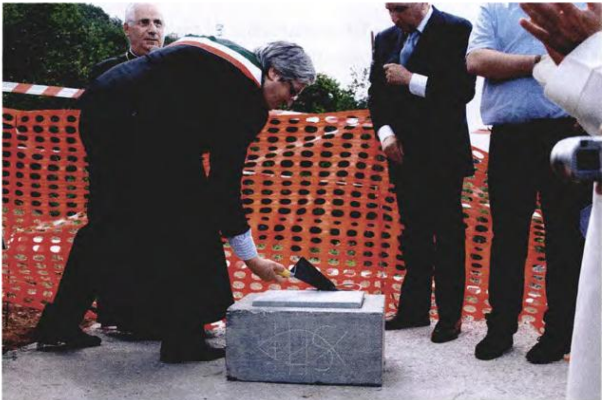
Posa prima pietra Monastero S. Maria di S. Damiano - Conflenti