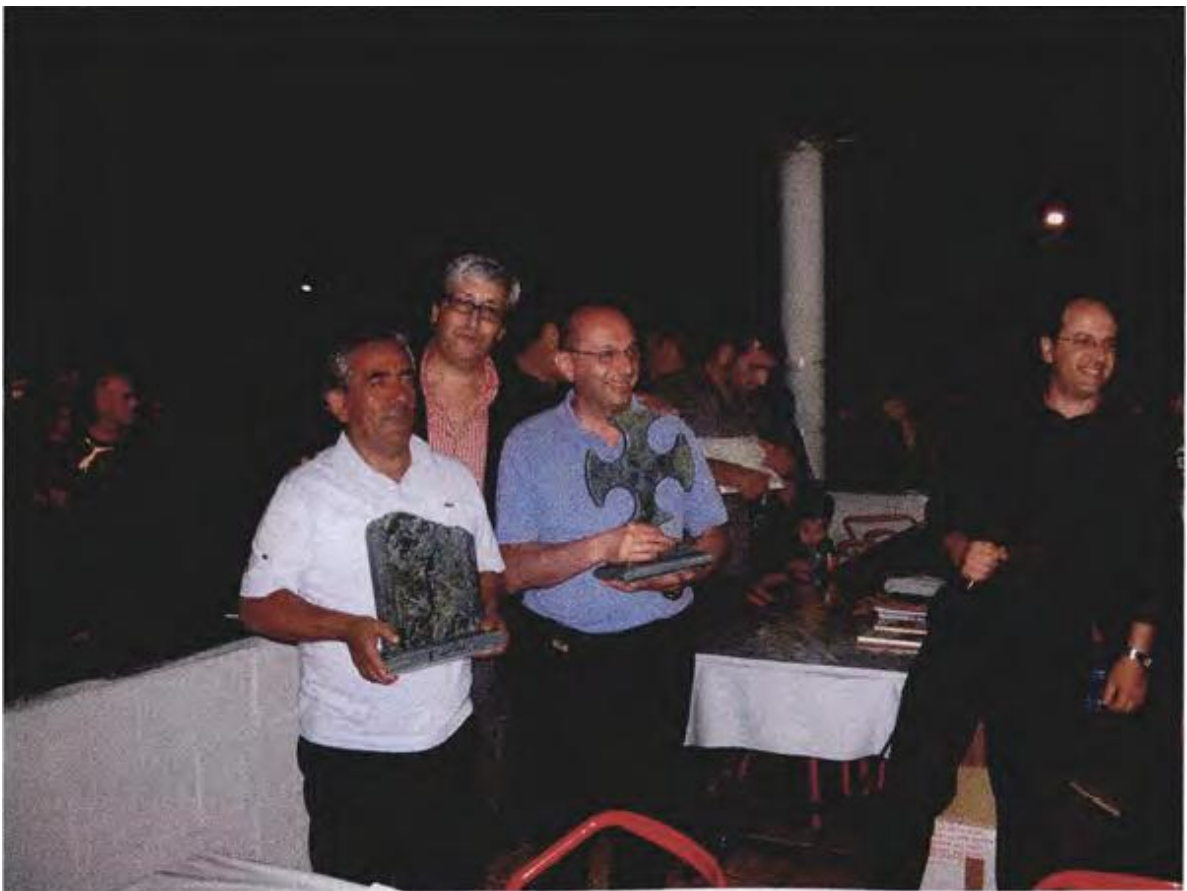
Visita istituzionale a Borgo Ticino (NO)